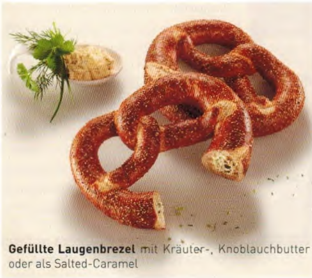
Gefüllte Laugenbrezel mit Kräuter-, Knoblauchbutter oder als Salted-Caramel

Die Brezelbäckerei Ditsch hat drei neue Laugenprodukte auf den Markt gebracht: zwei herzhaft gefüllte mit Kräuterbutter beziehungsweise Knoblauchbutter und eine süß-salzige Variante gefüllt mit Salted Caramel. Die Produkte sollen den Verbraucher*innen eine neuartige, geschmackvolle Kombination aus traditioneller Laugenbrezel, einer im Trend liegenden Füllung und einem passenden, attraktiven Topping bieten. Da sie bereits fertig gebacken sind, gelingen sie schnell und sicher: einfach auftauen oder für mehr Knusprigkeit kurz im Ofen erwärmen. KE