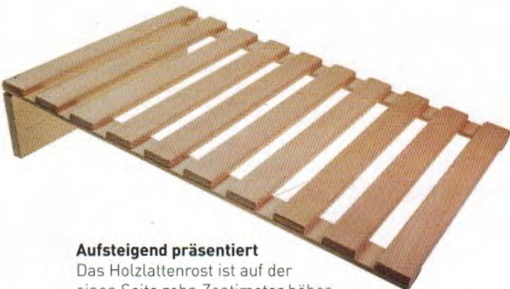
Aufsteigend präsentiert Das Holzlaternenrost ist auf der einen Seite zehn Zentimeter höher.

Der neue Holzlaternenrost von FMU bietet eine erweiterte Präsentationsmöglichkeit als Alternative zu Tablett, die in der Regel in der Thekenauslage zum Einsatz kommen. Das Neuartige daran ist, dass eine Seite erhöht ist, dadurch werden die ausgestellten Backwaren noch einladender präsentiert und rücken durch die Schräge noch näher